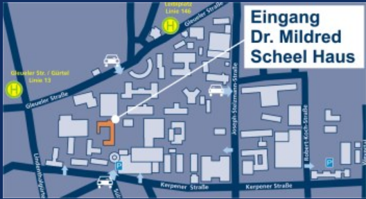
Gestaltung: MedizinFotoKöln Druck: Druckerei Uniklinik Köln