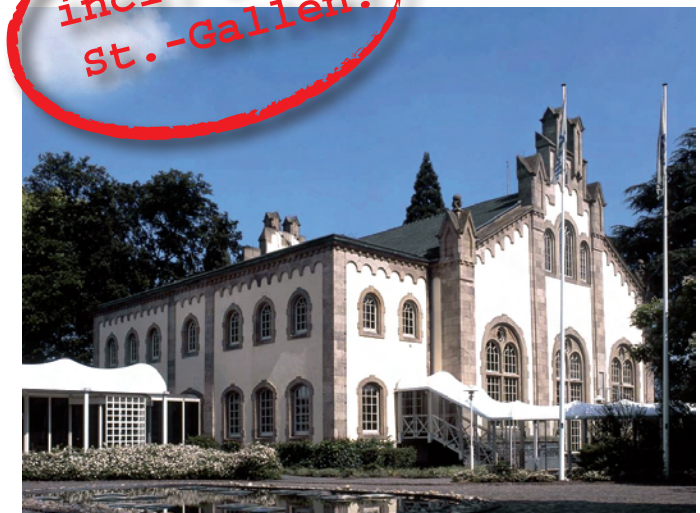
Altes Wasserwerk Bonn 21.03.2009

Die CME - Zertifizierung ist bei der Ärztekammer Nordrhein beantragt.